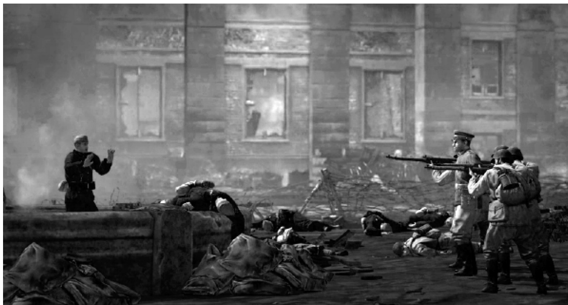
Рис. 2. Скриншот из игры Company of Heroes 2