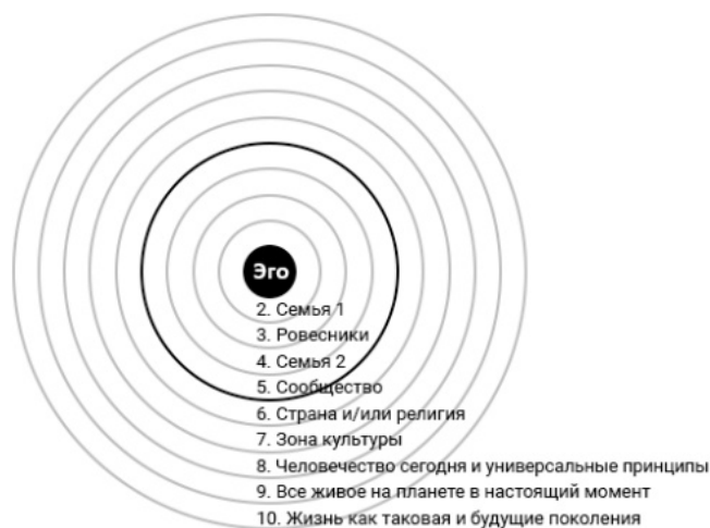
Рис. 1. Круги принадлежности

нг ( Bildung ) 11 . Она характеризует Бильдунг как подход, который позволяет не только осмыслить свободу как модус участия в созидании общего блага, но и идентифицировать каждого человека как участника общества, нации и всего мира, усиливая, таким образом, индивидуальную ответственность за человечество и мир в целом (Andersen, 2020, p. 20). В своей последующей работе Андерсен дала такое определение этому понятию: « Бильдунг — это сочетание образования и знаний, необходимых для процветания в отдельно взятом обществе, а также моральной и эмоциональной зрелости, позволяющей вам быть одновременно командным игроком и располагать личной автономией» (Андерсен, 2021, с. 1). Систему социальной идентификации каждого человека она представила в виде десяти концентрических кругов принадлежности (рис. 1).