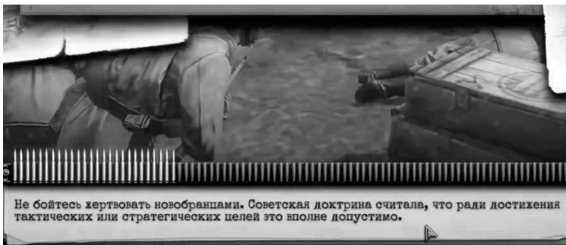
Рис. 3. Скриншот из игры Company of Heroes 2