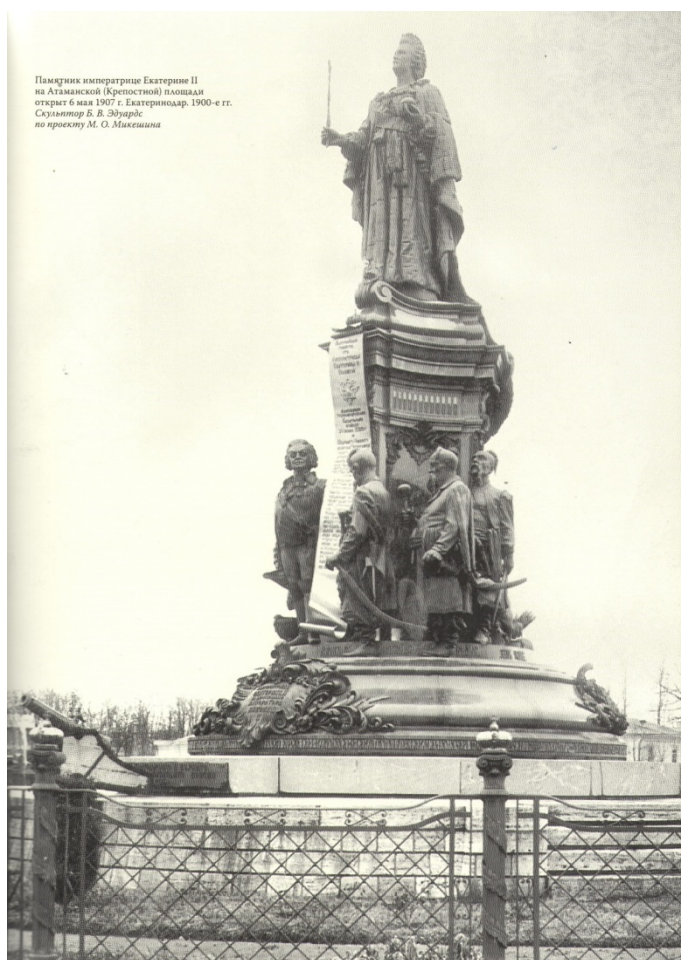
Рис. 2. «Памятник Екатерине II» (оригинальный вид, 1907)

Судьба памятника оказалась полна драматизма, и его история плотно вплелась в историю города и края. Но при этом монумент приобретает нарративный потенциал. Автор проекта скончался, оставив только эскизы. Продолжил и завершил проект одесский скульптор и литейщик Борис Васильевич Эдуардс. Фундамент монумента был залит в сентябре 1896 года, а открытие памятника состоялось спустя 11 лет, 6 мая 1907 года (рис. 2).