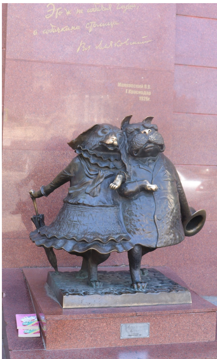
Рис. 9. Скульптурная композиция «Влюбленные собачки / Собачья глушь / Гуляющие собачки». 2023

В.П. Пчелин в одном из интервью пояснил смысл своего творения: «“Собачкина столица” — это игровая юмористическая городская скульптура, навеянная литературным произведением. Я шел от того, что собаки во многом повторяют образ своих хозяев. Поэтому и делал потрет не собак, а их владельцев. Вышли на чинную прогулку самодовольные, сытые, по-нэпмански нарядные. Тут абсолютно нет идеи, что это собаки, которые должны охранять и защищать. Это благополучные, умиро-