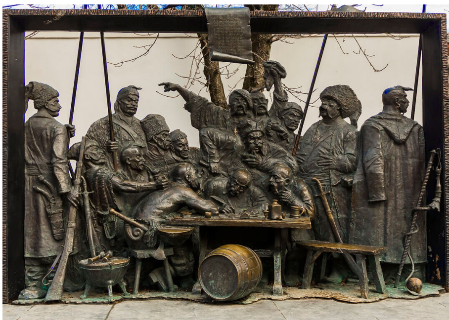
Рис. 7. Скульптурная композиция «Запорожские казаки пишут письмо турецкому султану».