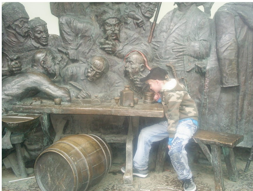
Рис. 8. Юный житель Краснодара ощущает свою идентичность с городом и культурно-историческую связь («кодую» память) со своими предками-казаками в канун Великого праздника, Великой Победы 9 мая. Фото А. В. Вандышевой, 2011

Казаки в скульптуре выполнены в натуральную величину. Фигуры стоят на уровне тротуара так, чтобы любой человек мог подойти к ним и почувствовать себя сопричастным историческому событию. Для этого автор использует нетривиальный ход: в композицию встроены, на первый взгляд, инородный элемент — рядом с казаками на скамейке оставлено одно свободное место, мотивирующее зрителей, «читателей», на минуту стать частью исторического нарратива (занять позицию внутри текста). По нашему мнению, данный элемент не только эффектно вписался в композицию, но и создал для горожан дополнительную возможность упрочить ощущение своей городской идентичности (рис. 8).