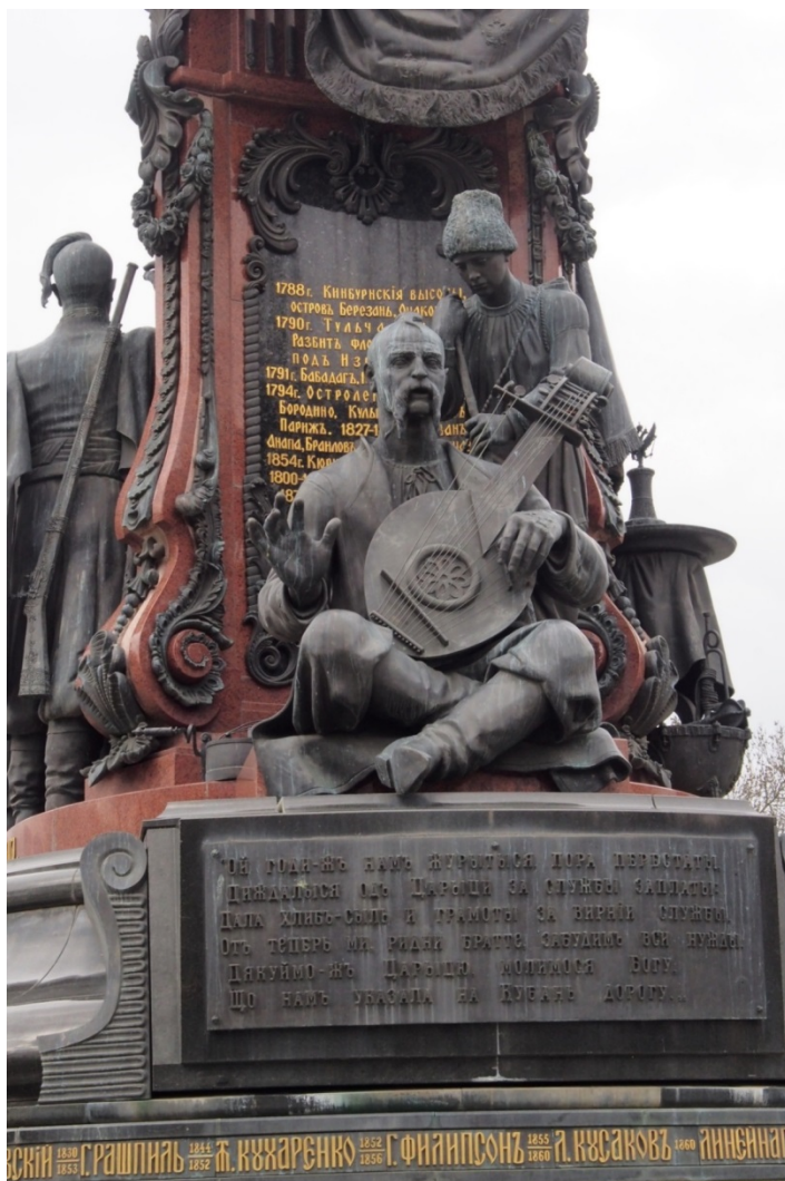
Рис. 6. Обратная сторона «Памятника Екатерине» Фото И. А. Аполлонова, 2019

Помещение кобзаря с поводырем под сень императорской мантии подчеркивает патернализм в отношении государственной власти к простому народу. При этом кобзарь поет казачью песню, прославляющую щедрый дар императрицы. Куплет из этой песни помещен на постаменте памятника (рис. 6).