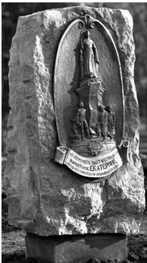
Рис. 3. Памятный знак на месте будущего монумента «Памятник Екатерине II». Фото Б.Н. Устинова, 1994