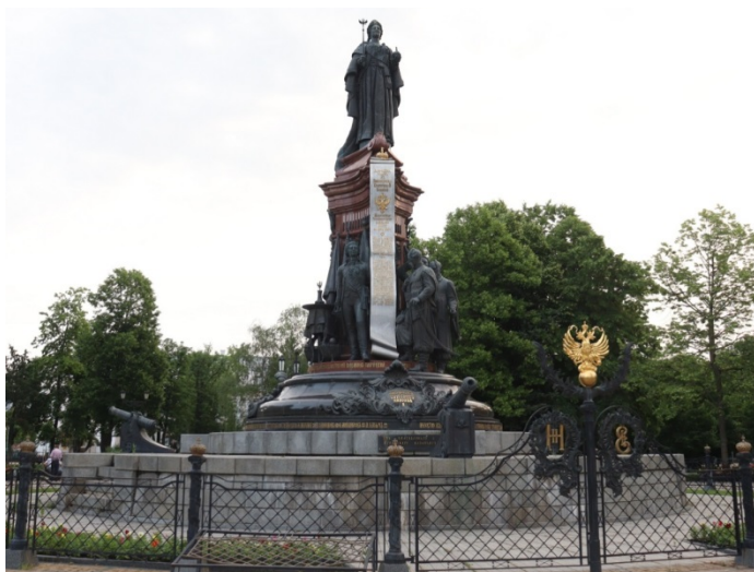
Рис. 4. Воссозданный «Памятник Екатерине II». Фото И. А. Аполлонова, 2023