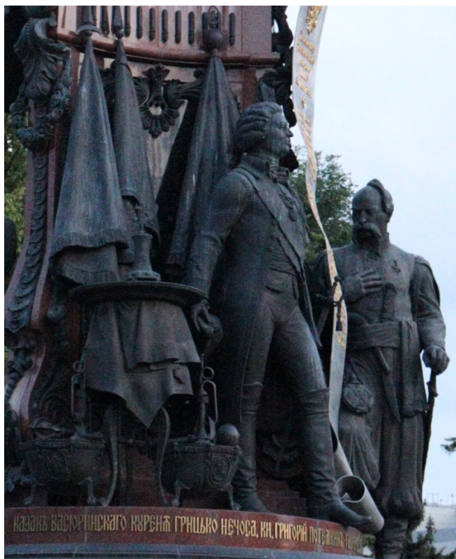
Рис. 5. Образ князя Григория Потемкина. Фото И. А. Аполлонова, 2023

В данном контексте семиотически значима художественная трактовка князя Григория Потемкина, фигура которого расположена на противоположной от казацких атаманов стороне постамента, что подчеркивает его роль проводника императорской власти в южнорусском фронтире. Образ князя, полный сдержанного достоинства и значимости, как бы транслирует выраженное в фигуре Екатерины II царственное величие империи. Жестом он указывает на многочисленные дары, которыми осыпала самодержица переселенцев за их верную службу 1 . Вместе с тем помещение фигуры Потемкина на одном ярусе с атаманами указывает на его посредничество между воинственными потомками мятежной Сечи и императрицей. Данный семантический аспект подчеркивает надпись на постаменте, которая атрибутирует фигуру представителя империи прежде всего как «казак Васюринского куреня Грицько Нечёса» и лишь потом как «князь Григорий Потемкин-Таврический» (рис. 5).