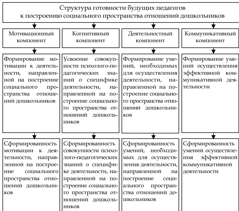
Рис. 1. Структура готовности будущих педагогов к построению социального пространства отношений дошкольников

В рамках новой парадигмы образования, основанной на создании условий для проявления и развития профессиональных и личностных функций субъектов педагогического процесса, основным требованием к подготовке студентов становится развитие у них готовности к профессиональной деятельности, в связи с чем формирование готовности к построению социального пространства отношений дошкольников является неотъемлемой частью процесса профессиональной подготовки в вузе, которая может быть осуществлена при помощи новых способов обучения. Решение данной проблемы эффективно через разработку модели формирования готовности.