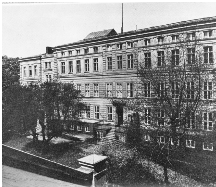
Зоологический музей в Кёнигсберге, 1930 г.