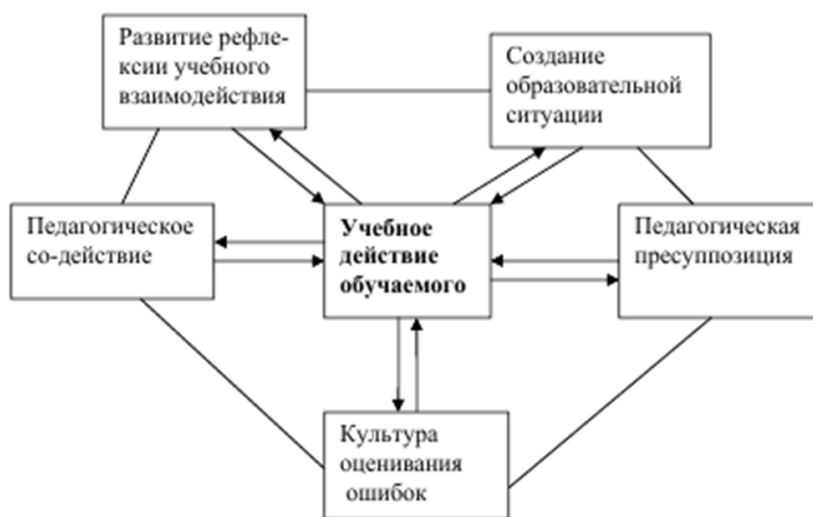
Рис. 1. Структура учебного взаимодействия (в модификации А.Н. Утехиной)

В диссертации Н.Е. Крючковой, посвященной проблеме формирования эффективного взаимодействия между учителем и учащимися, отмечается, что «для регулирования взаимодействия между учителем и учащимися следует предусмотреть специальные формы и методические приемы работы, направленные на формирование данного взаимодействия в процессе обучения» [5, с. 4]; например, это могут быть диалогическое общение, игры, интерактивный характер предлагаемых учащимся заданий, которые требуют сотрудничества, взаимопомощи, установления контакта с партнером, постоянного поддержания общения; учет возрастных особенностей школьников; ориентация на равнопартнерские отношения на основе открытости, естественности, доверия, принятия всех возможных ответов учащихся [5].