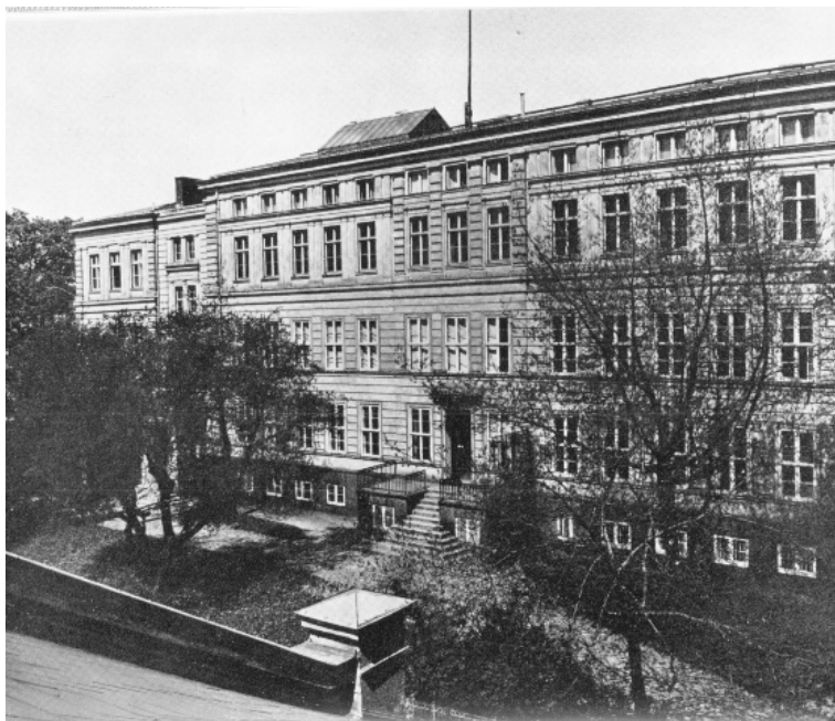
Зоологический музей в Кёнигсберге, 1930 г.