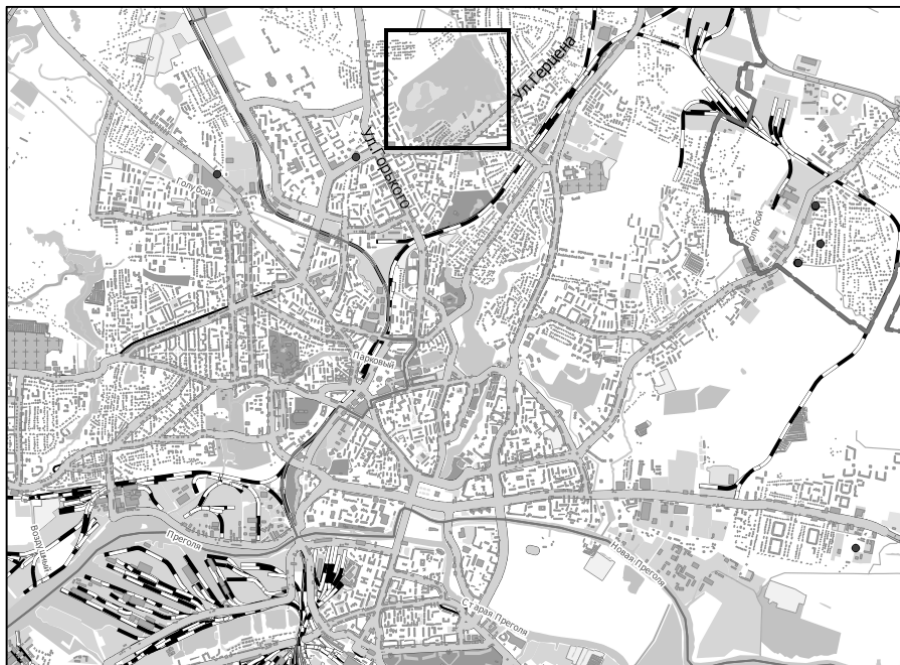
Рис. 1. Местоположение парка им. М. Ашманна

Неоспоримо влияние зеленых насаждений на улучшение мезо- и микроклимата в городах и селах. Парковые зоны обеспечивают благоприятные санитарно-гигиенические условия в пространственной организации различных видов деятельности (труда, быта, отдыха). Их создание в областном центре и области имеет давнюю историю и было обусловлено необходимостью улучшения экологической ситуации. Наибольшую площадь в Калининграде в довоенное время занимал парк Макса Ашманна (рис. 1), территория которого и в настоящее время является круглогодичным местом отдыха для жителей интенсивно застраиваемых районов Сельмы и Северной Горы. Однако в условиях влажного климата в период выпадения осадков почва здесь становится переувлажненной, а в некоторых местах стоит вода. Любое обустройство большей части территории парка зависит от проведения грамотной реконструкции мелиоративных систем с учетом современных полевых изыскательских работ и историко-географического подхода.