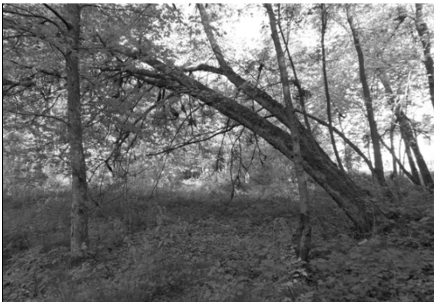
Рис. 3. Гибель деревьев от переувлажнения почвы

увлажнение — особенно характерен для юго-западной и южной частей с плоским пониженным рельефом на тяжелых и двучленных отложениях. Сохранившиеся здесь старовозрастные деревья — дуб, клен, липа — свидетельствуют о том, что экологические условия произрастания для них были комфортными, а лесопосадки создавались на основе осушения. В настоящее время корневая система древостоя испытывает длительное переувлажнение, что приводит к гибели растений (рис. 3).