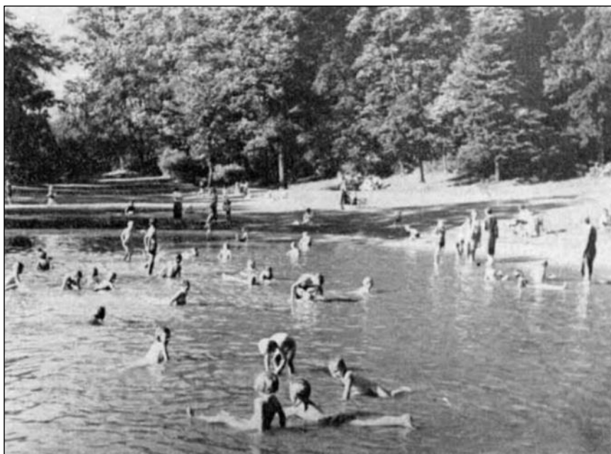
Рис. 2. Парк до середины XX столетия

В парке были обустроены игровые площадки, дороги для верховой езды шириной 6 м, обсаженные на всем протяжении дубом черешчатым. На возвышении располагался ресторан «Маленький лесной замок». Прогулочные дорожки были покрыты крошкой из красного кирпича и весьма удобны для прогулок даже после дождя благодаря хорошей дренированности. Через сеть осушительных каналов имелись переходы, а через ручей Beydrytter Fließ – 10 мостиков [11].