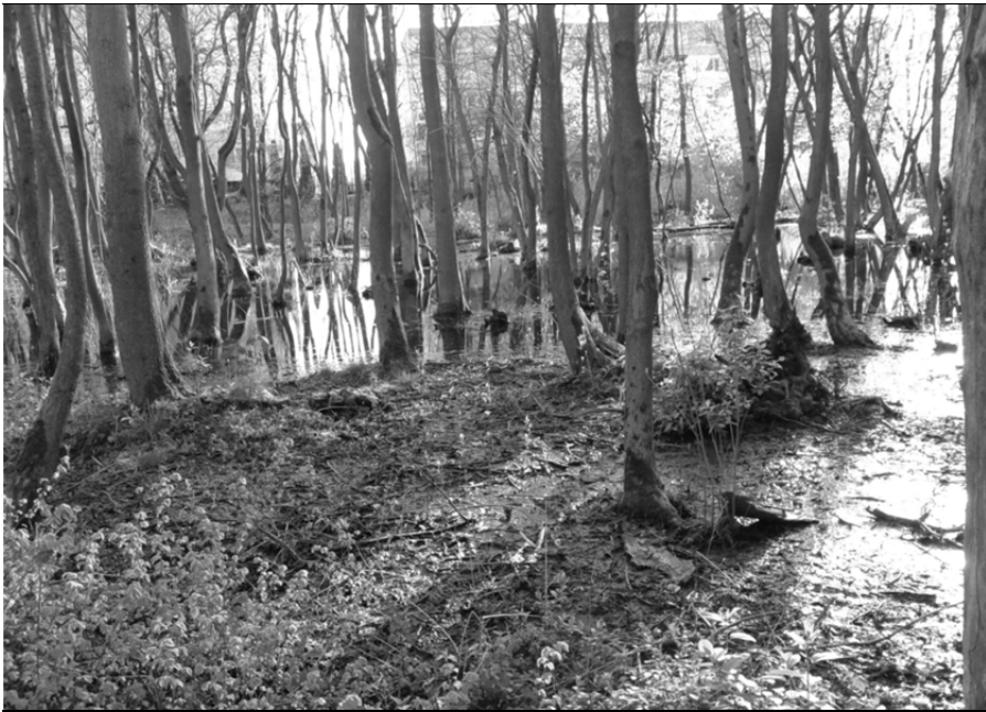
Рис. 4. Затопленные участки

При выделении ландшафтной структуры использовалась общепринятая методика А.Г. Исаченко [6]. За единицу картографирования было принято урочище (рис. 5).