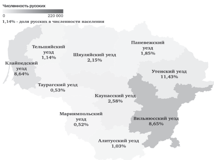
Рис. 3. Доля русского этноса в Литве, 2022 г., % [26]

Доля русских в численности населения уездов представлена на рисунке 3. Мы видим, что только в трех уездах, два из которых граничат с Беларусью и один с Калининградской областью, доля русских составляет около 10 % от общей численности населения того или иного уезда. Таким образом, можно сказать, что на территории литовских уездов представленность русской диаспоры выражена крайне незначительно.