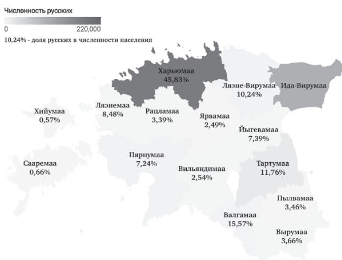
Рис. 1. Доля русского этноса в Эстонии, 2022 г., % 1

Практически во всех анализируемых нами муниципалитетах Эстонии доля русских падает, однако в муниципалитете Пылвамаа заметно ее небольшое увеличение. Это связано не с приростом численности русского населения, а с естественной убылью эстонского, а также с миграционным оттоком, так как данный муниципалитет является приграничным с Псковской областью.