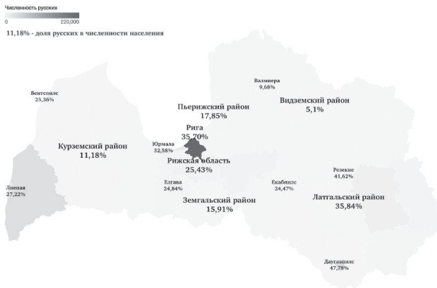
Рис. 5. Доля русского этноса в Латвии, 2022 г., % 1

дагский (65 чел.), Дурбский (63 чел.), Яунпилсский (43 чел.) и др. Латвия разделена на самое большое количество муниципалитетов по сравнению с другими странами Прибалтики, и она имеет самое большое количество малозаселенных русскими регионов [22].