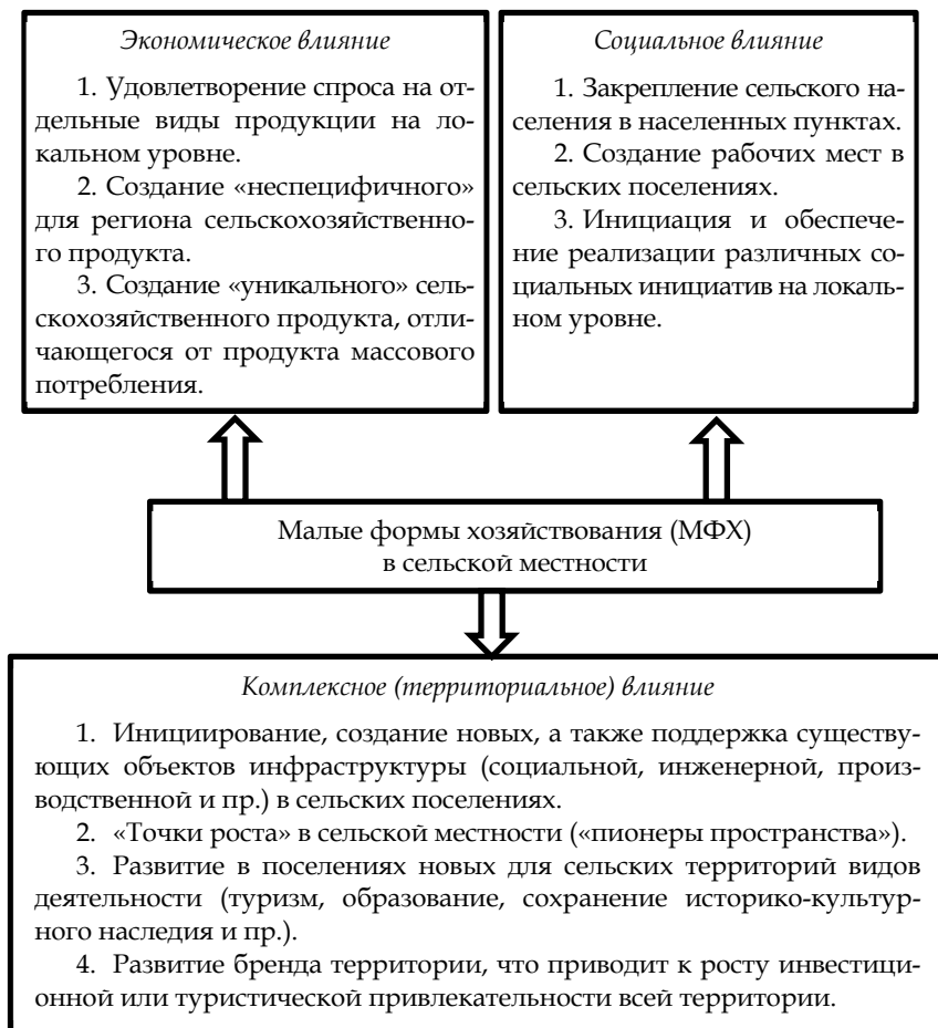
Рис. 1. Схема комплексного социально-экономического влияния малых форм хозяйствования на сельскую территорию

Ценность малых форм хозяйствования в сельской местности определяется в большей степени не столько экономическим, сколько комплексным их влиянием на развитие сельских территорий. В обобщенном виде предложенная логическая схема влияния МФХ на сельскую территорию представлена на рисунке 1.