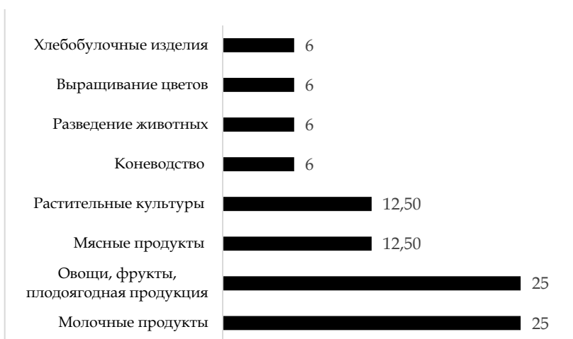
Рис. 3. Распределение респондентов по отраслям производства, %

Специализация производителей тоже оказалась достаточно разнообразной. Так, 25 % занимаются производством молочной продукции, еще 25 % заняты выращиванием овощей, фруктов и плодоягодной продукции, 12,5 % — выращиванием растительных (зерновых и масленичных) культур, еще 12,5 % — производством мясной продукции, а остальные (около 6 % каждый) — коневодством, выращиванием цветов, производством хлебобулочных изделий, а также выращиванием и разведением животных. Распределение респондентов по отраслям производства представлено на рисунке 3.