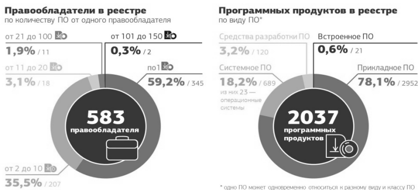
Рис. 1. Содержание реестра российского ПО [14]

По данным Министерства цифрового развития, связи и массовых коммуникаций РФ, на конец марта 2018 г. в Едином реестре российских программ для электронных вычислительных машин и баз данных зарегистрировано 4346 отечественных программных продуктов [13]. На 17 октября 2016 г. среди программных продуктов, создаваемых в РФ, наибольшую долю занимает прикладное программное обеспечение (78 %) для решения специфических задач отдельных отраслей производства. «К этому классу правообладатели отнесли 1259 своих продуктов. Среди системного ПО лидируют средства обеспечения информационной безопасности (263 продукта)» [14].