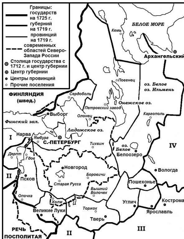
Рис. 1. Соотношение территории современных областей Северо-Запада России и Санкт-Петербургской губернии в 1719–1725 гг.

На протяжении губернского периода число единиц АТД первого порядка, охватывающих современную территорию Северо-Запада России, менялось от одной в 1708–1727 гг. (Ингерманландская / Санкт-Петербургская губерния) (рис. 1) до шести, начиная с 1784 г. (Санкт-Петербургская, Новгородская, Псковская, Олонецкая, Выборгская и Полоцкая (Витебская) губернии / наместничества) (рис. 2).