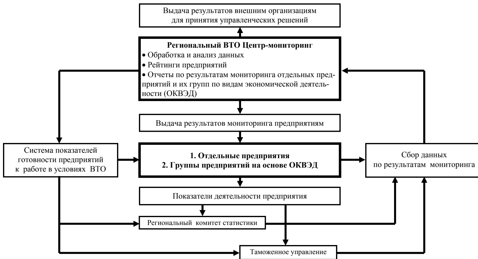
Рис. 2. Схема модели мониторинга готовности предприятий субъекта РФ к работе в условиях ВТО