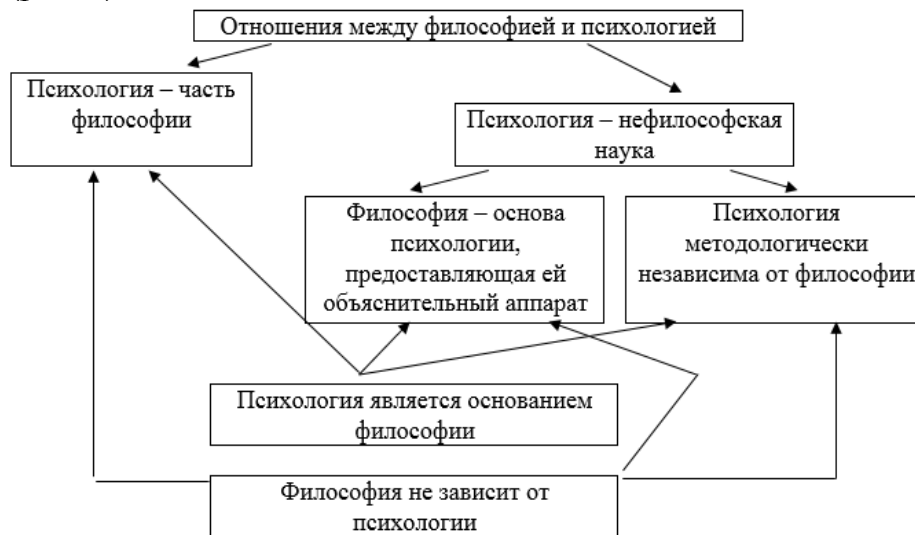
Рис. 2. Отношения философии и психологии

Обобщая представленные в русской философской среде варианты интерпретации отношений между психологией и философией, покажем основные связи между ними (рис. 2).