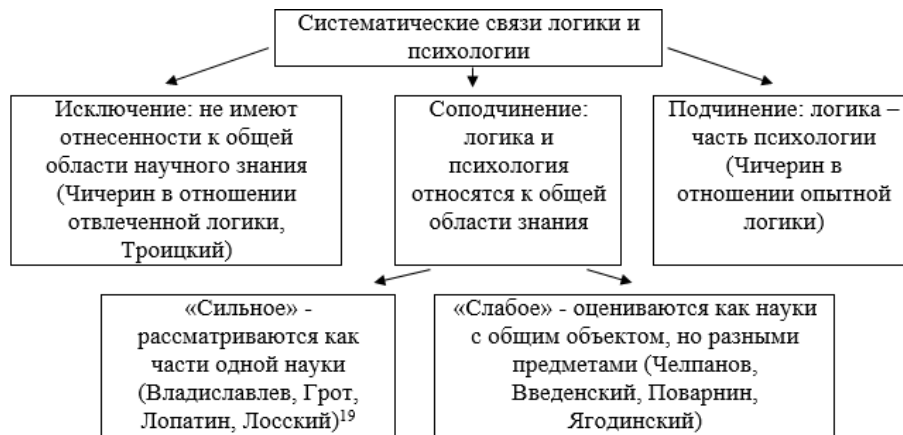
Рис.3. Систематические связи логики и психологии

Если вопрос интерпретации формальных связей наук был обязательным атрибутом их авторских образов и обсуждался в границах триады «гносеология – логика – психология», то проблема взаимозависимостей как предмет специального анализа ставилась не всеми учеными. Тем не менее, на основании текстовых свидетельств можно осуществить попытку их реконструкции.