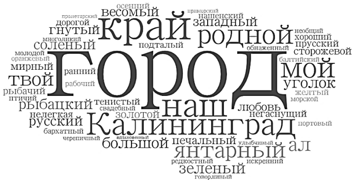
Рис. 1. Контекст упоминания слова «город»

Использование понятий «свое», «чужое» и «присвоение» связано с интерпретацией философской концепции Б. Вальденфельса [5, с. 78; 15, с. 149], рассмотренной в работах искусствоведа И. В. Белинцевой по отношению к Калининградской области [3, с. 152]. Для того чтобы «чужое» стало «своим», должен пройти особый процесс его изучения и понимания, то есть «присвоения» неизвестного. В Калининградской области именно в период Перестройки, с запозданием, осуществлялся интенсивный процесс «присвоения» довоенного прошлого региона [9, с. 105–120].