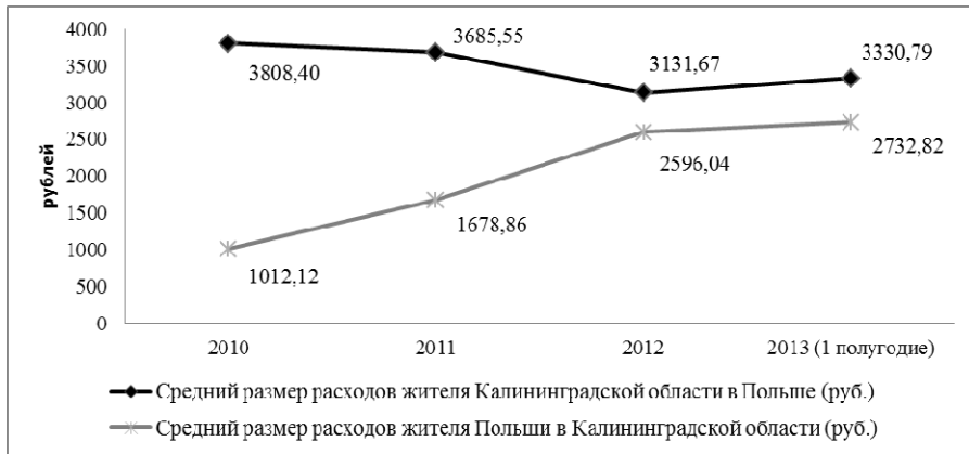
Рис. 3. Средний размер расходов одного человека, пересекавшего российско-польскую границу с 2012 г. по II полугодие 2013 г.

На основе данных таблицы 5 и показателей числа пересечений государственной границы (см. рис. 1) можно рассчитать среднегодовой объем расходов одного человека во время его пребывания за границей (рис. 3).