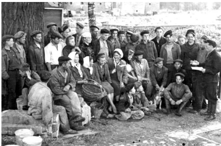
Рис. 1. Сельский сход в одном из сел Озёрского района. 1949 г.

Еще хуже дело обстояло с техникой и инвентарем. Если кому-то и доставались трактор или машина, списанные из армии, то они требовали сложного и дорогостоящего ремонта. Инструмент же приходилось собирать по окрестным хуторам и заброшенным поместьям; собственно, на первых порах переселенцы ничем другим и не занимались. Увлечение «сбором трофеев» с их последующей продажей (чаще всего в Литве, где очень ценился немецкий инвентарь) приобрело такие масштабы, что руководству колхозов пришлось вводить запреты на «трофейные экспедиции» и «повальную спекуляцию». Если какой-то инструмент и остался в колхозе, то почти весь он был разобран по личным хозяйствам [8, л. 20].