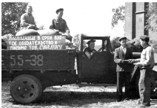
Рис. 4. Отправка машины с зерном нового урожая на заготовительный пункт из колхоза «Победа» Гвардейского района. Июль 1949 г.