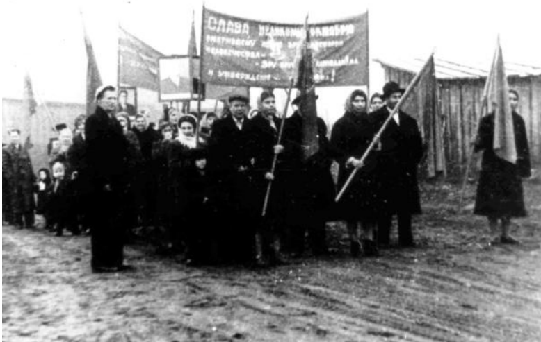
Рис. 5. Праздничная демонстрация в честь годовщины Октябрьской революции в одном из поселков области в начале 1950-х гг.

го 6 кг, меда 35 кг 4 , молока 80 литров, картофеля 200 кг» [27, л. 28]. Артели победнее организовывали для своих членов после доклада довольно скромное угощение «с мясом из расчета 200 граммов на трудоспособного» [28, д. 5, л. 23] или всего лишь выдавали школьникам на подарки «10 кг муки пшеничной и 150 руб. денег» [там же, д. 3, л. 39 об.]. Районные власти бдительно следили за такого рода инициативами, подрывавшими, по их мнению, благосостояние артелей. Так, в отношении колхоза «Красный Октябрь» Приморского района в 1947 г. райсельхозотдел провел настоящее расследование и принял решение «О неправильном праздновании в честь Октябрьской революции за счет колхоза», по которому участников обеда заставили из собственного кармана оплатить все расходы на праздник (5 тыс. рублей, 40 кг муки, 30 кг мяса, 75 кг картофеля) [там же, д. 2, л. 40–41].