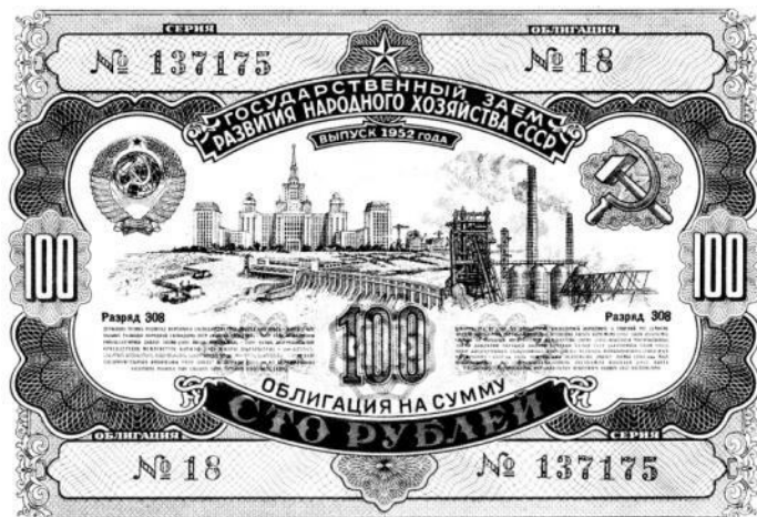
Рис. 3. Облигация государственного займа развития народного хозяйства СССР 1952 г. номиналом в 100 рублей

Самым распространенным способом покрытия расходов на выкуп облигаций было авансирование (с молчаливого согласия районного начальства) колхозников со счета в Госбанке. При этом одновременно принималось решение на месяц, а то и на больший срок «прекратить расходование средств из колхозной кассы, не связанное с подготовкой и проведением займа» [17, л. 71–71 об.]. Но чаще всего и счета были пусты, и тогда приходилось прибегать к нестандартным действиям.