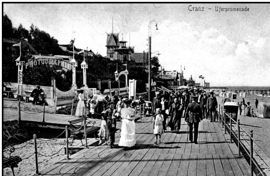
Рис. 4. Вывеска «Фотография», указывающая на местонахождение фотоателье Фритца Краускопфа в Кранце

Ф. Краускопф родился в 1882 г. в Растенбурге, после четырехлетней военной службы он открыл в 1920 г. свое собственное фотографическое дело в Кёнигсберге и Кранце (рис. 4). До Второй мировой войны часто разъезжал по Восточной Пруссии и фотографировал виды для открыток. Издательство получило от него от 800 до 1000 фотографий. Ф. Краускопф закончил свою жизнь в Восточной Пруссии, которую не захотел покидать, в 1945 г.