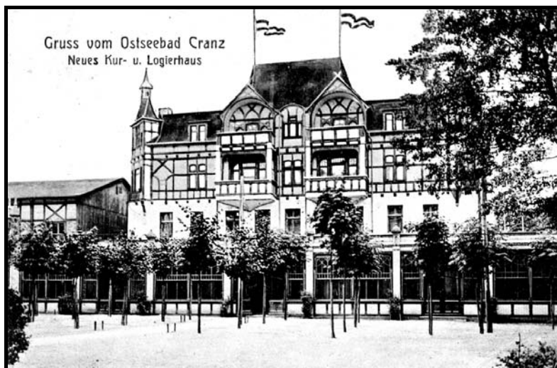
Рис. 3. Курхаус в Кранце, 1910 г.

Наконец, есть фотографии, которые прямо с курортной жизнью не связаны. Они сообщают нам о других сферах жизни этих мест, например о рыбном или о янтарном промыслах. Так, сохранились многочисленные изображения рыбаков с камбалой, которая вылавливалась под Кранцем до Второй мировой войны. Пауль Кекер фотографировал янтарное производство в Пальмникене/Янтарном.