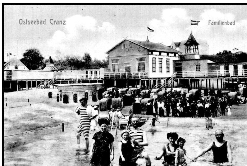
Рис. 2. Семейная купальня в Кранце, 1910 г. (коллекция Г. Клемма)

Вторая группа состоит из фотографий, изображающих повседневную жизнь отдыхающих. На них видны люди, прогуливающиеся по променаду, сидящие в плетеных креслах с тентом на пляже, купающиеся в море. В основном сфотографированы не отдельные люди, а группы отдыхающих (рис. 2). Имена лиц, изображенных на таких фотографиях, установить для историков фактически невозможно. Ценность таких изображений состоит, однако, в том, что они показывают морской курорт как публичное место и сообщают нам о занятиях отдыхающих. При сравнении фотографий и открыток XIX и XX столетий можно установить изменения, произошедшие, например, в моде.