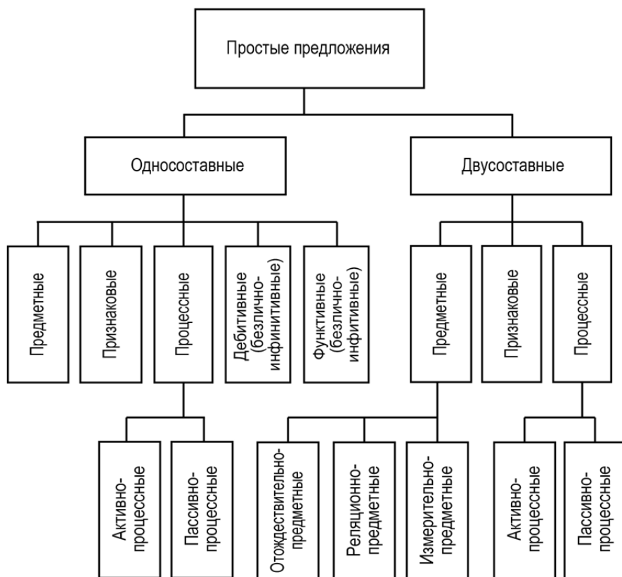
Рис. 1. Семантико-функциональная классификация русских простых предложений