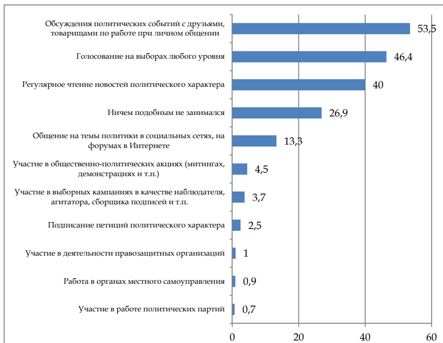
Рис. 2. Ответы на вопрос «Приходилось ли вам в течение этого года участвовать в политической жизни? Если да, то в каких формах?» (%)