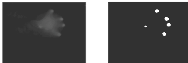
Рис. 3. Использование h(O(x), f) = \frac{\sum_{y \in O(x)} f(y)}{\|O(x)\|} в технологии мультисенсорного дисплея

Этот метод при удачно выбранной окрестности O(x) и параметре p дает очень хорошие результаты, которые можно использовать на практике. На рисунке 3 показан пример использования этой функции в технологии мультисенсорного дисплея [1].