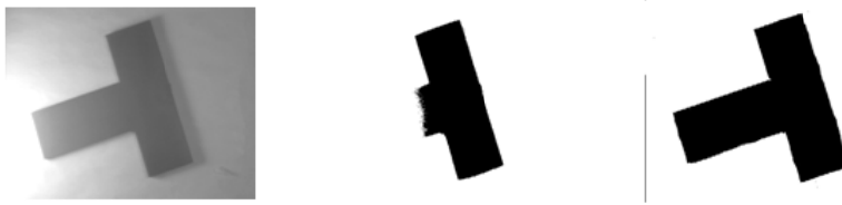
Рис. 2. Неприменимость глобальной пороговой бинаризации на практике

Очевидно, что такой метод учитывает лишь характеристики текущей точки и использует глобальный для всего изображения параметр, что делает его непригодным для применения на практике. Этот факт проиллюстрирован на рисунке 2. Из-за неравномерной освещенности исходного изображения (крайнее слева) данный метод показывает неудовлетворительный результат (по центру p = 0,5 ). Ожидаемый же результат (справа) дает метод адаптивной бинаризации.