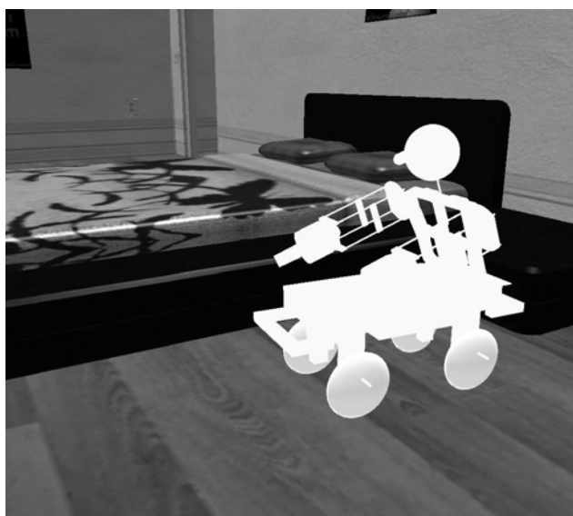
Рис. 1. Модель разрабатываемого робота

Дальнейшее развитие рассматриваемой модели состоит прежде всего в совершенствовании высокоуровневых алгоритмов управления роботом, а именно в создании высокоуровневой системы управления, которая должна обеспечивать согласование работы уже отлаженных алгоритмов, программирование более сложных поведенческих актов, а также накопление и обработку приобретенных знаний об окружающем предметном мире.