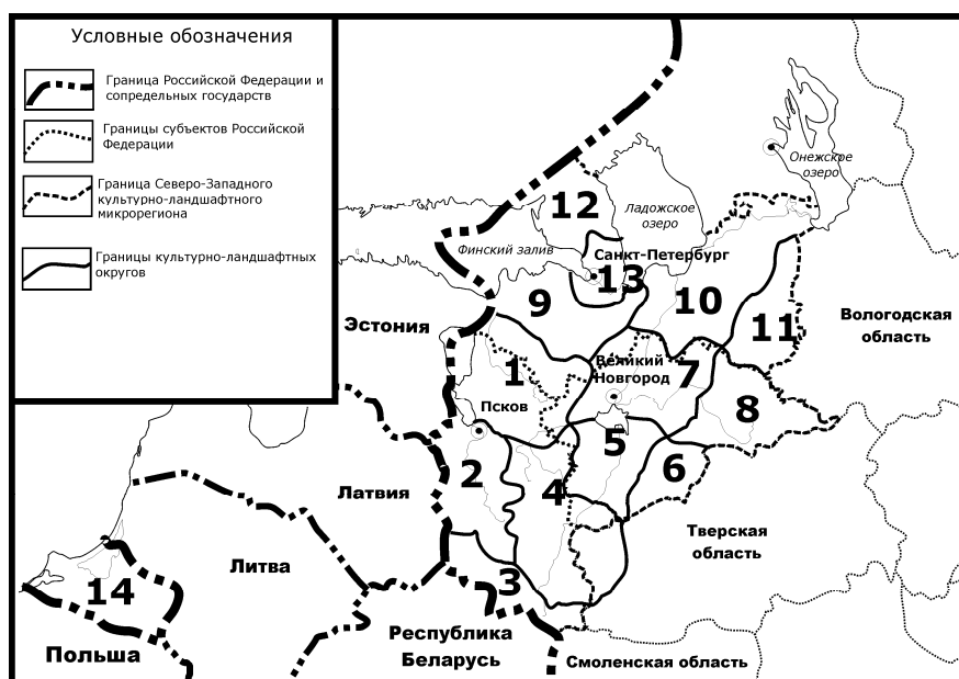
Рис. 2. Культурно-ландшафтные округа Северо-Западного культурно-ландшафтного микрорегиона: 1 — Гдовско-Плюсский; 2 — Псковско-Великоречский; 3 — Южный (Невельско-Себежский); 4 — Восточно-Псковский (Шелонско-Ловатский); 5 — Ильменский; 6 — Валдайский; 7 — Новгородский; 8 — Тихвинский; 9 — Ижорско-Ладожский; 10 — Волховско-Свирьский; 11 — Вепсовский; 12 — Выборгский; 13 — Санкт-Петербургский; 14 — Калининградский

В пределах четырех культурно-ландшафтных провинций Северо-Западного микрорегиона нами было выделено 13 культурно-ландшафтных округов, в качестве 14-го КЛО обозначена территория Калининградской области (рис. 2). Обобщим основные группы признаков и факторов, учитывавшихся при районировании Северо-Запада России на уровне культурно-ландшафтных округов.